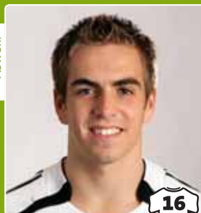
Marcell Jansen (04.11.1985) FC Bayern München