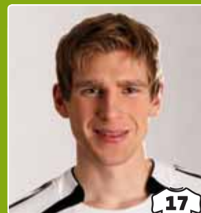
Philipp Lahm (11.11.1983) FC Bayern München