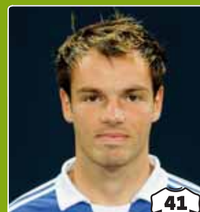
Christoph Metzelder (05.11.1980) Real Madrid