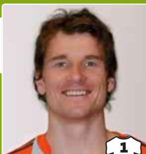
Robert Enke (24.08.1977) Hannover 96