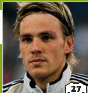
Arne Friedrich (29.05.1979) Hertha BSC Berlin