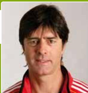
Joachim Löw (03.02.1960) Bundestrainer