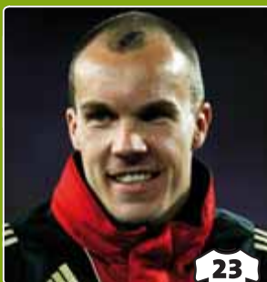
Rene Adler (15.01.1985) Bayer Leverkusen