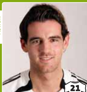
Per Mertesacker (29.09.1984) Werder Bremen