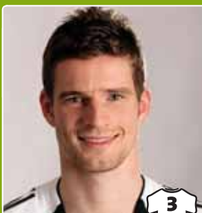
Jens Lehmann (10.11.1969) FC Arsenal